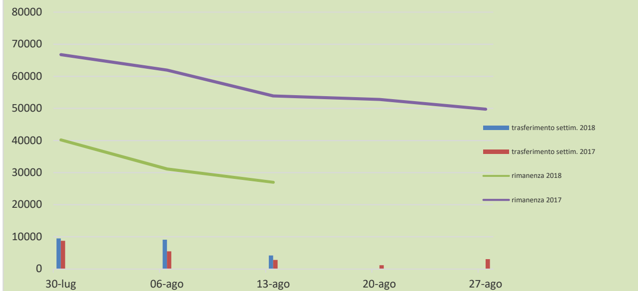
Trasferimento e rimanenza settimanale Gruppo Lungo A